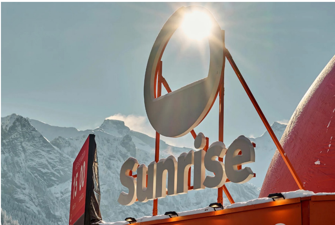
Sunrise am Audi FIS Ski World Cup Adelboden.